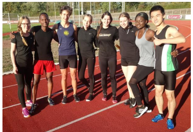
Oben: Das TrackTeam von seiner fröhlichen Seite.